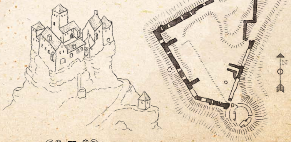
Rekonstruktion der Burg Lindelbrunn

Der gekränkte Punker verlässt den Ritter und schließt sich den Truppen des Pfalzgrafen Ludwig (Ludwig der Bärtige) an. Der Meisterschütze findet Anerkennung bei dem Kriegsvolk, kann aber die erlittene Kränkung